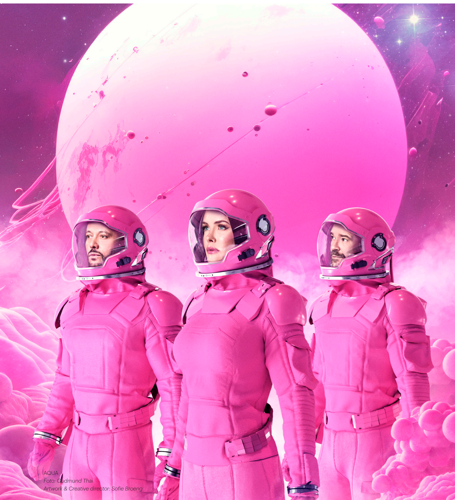
AQUA Artwork & Creative director: Sofie Broeng